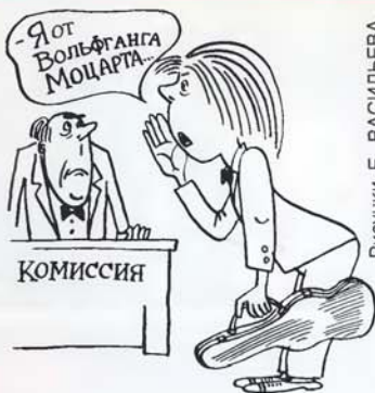
Рисунки Е. ВАСИЛЬЕВА

От редакции: За все средства массовой информации ответить не можем, а сами постараемся учесть этот упрек.