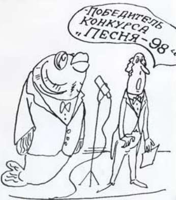
Конкурс «Вокруг звука» продолжается...